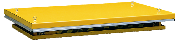
Table position basse avec anneaux