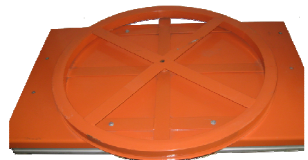
PLATEAU PIVOTANT POUR TABLE ELEVATRICE 1 TONNE