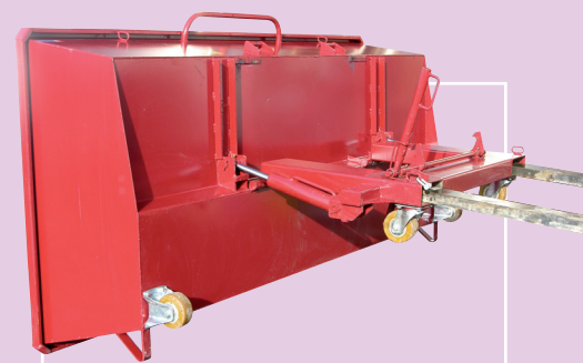
Basculement amorti par vérins ralentisseurs