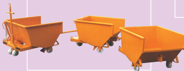
Timon traction attelage