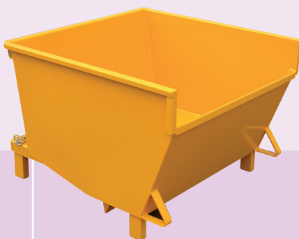
Standard sur socle