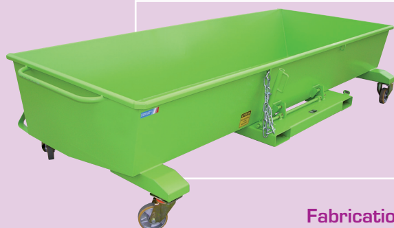
Fabrication spéciale sur-mesure, voir pages GSS, 14 et 15