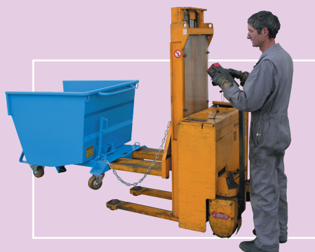
Fourreaux spéciaux prise Gerbeur