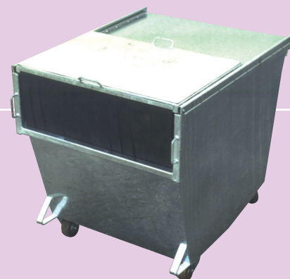
Couvercle coulissant à lanières