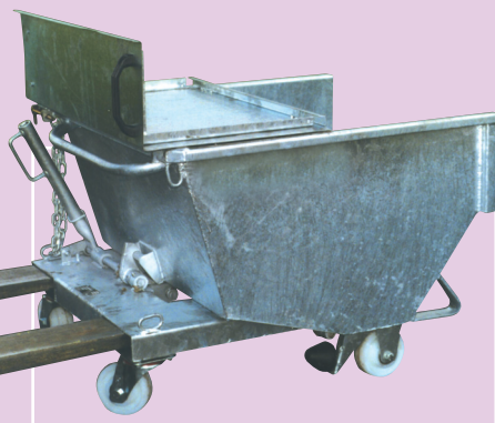
Version galva avec option couvercle articulé